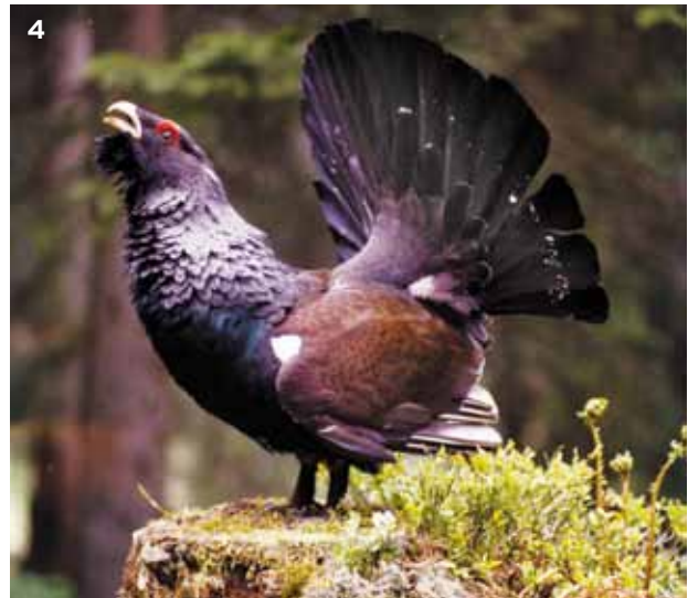
4 Das Auerhuhn ( Tetrao urogallus ) nimmt für schwierig zu verdauende Nahrung so genannte Magensteinein auf, die mit Hilfe des Muskelmagens die Nahrung zermahlt und aufschliesst.

Die Hauptnahrung im Sommer sind neben Heidelbeerblättern verschiedene Kräuter und Gräser. Die Küken fressen kleine Insekten wie z.B. Ameisen und Raupen. Im Herbst werden Heidel-, Him- und Vogelbeeren und deren Triebe