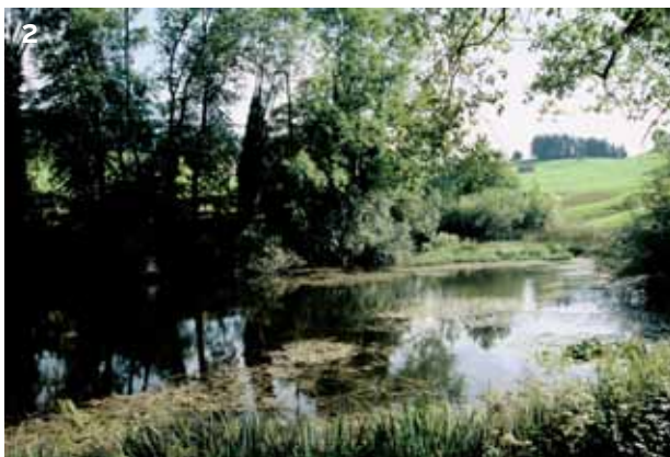
1 Die Kiesgrube List in Stein ist ein Amphibienlaichgebiet von nationaler Bedeutung. Dort kommen u. a. neben den geschützten Amphibien auch zahlreiche seltene Tiere aus der Klasse der Reptilien und Insekten vor.