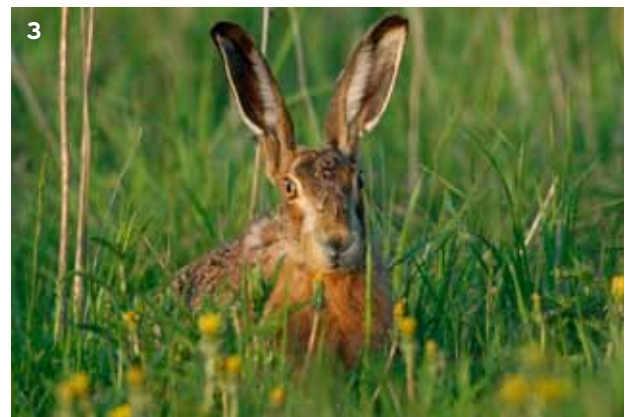
3 Der Feldhase ( Lepus europaeus ) kann auf der Flucht etwa drei Meter weit und etwa zwei Meter hoch springen. Er erreicht eine Laufgeschwindigkeit von maximal 70 km/h.

Der Feldhase hat ein vielfältiges Nahrungsspektrum, das von Süssgräsern über Kräuter, Hackfrüchte, Getreide, Raps, Knospen von Bäumen und Sträuchern bis zu jungen Trieben von Laubbäumen reicht. Nach einer ersten