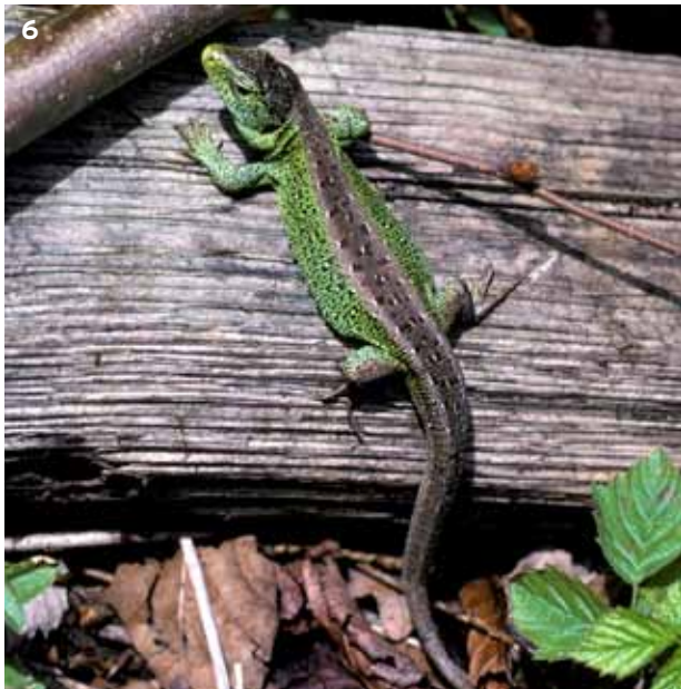
6 Die Zauneidechse ( Lacerta agilis ) kann, wie alle Eidechsen, einen Schwanzteil bei Gefahr abwerfen. Während dieser sich noch bewegt und den Feind ablenkt, kann die Echse flüchten.

Tage. Folgende Massnahmen können die Zauneidechsen fördern: