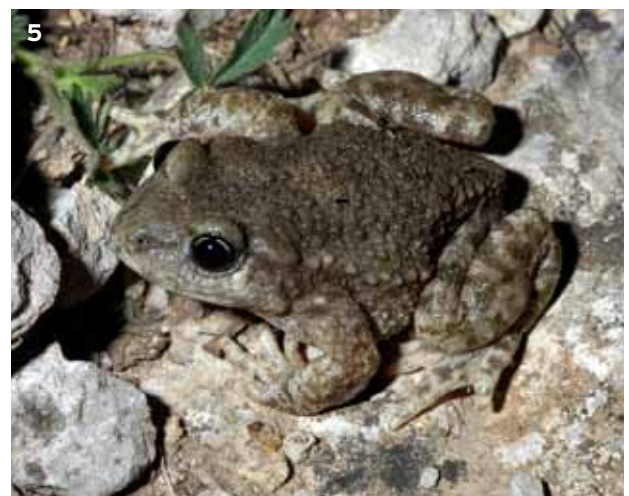
5 Nach der Paarung wickelt sich das Männchen des «Glöggfrosches» ( Alytes obstetricans ) die Laichschnur um seine Hinterbeine und trägt die Eier ca. 20-50 Tage mit sich herum, bevor die Larven im Wasser ausschlüpfen.

Die Fortpflanzungsbiologie der Geburtshelferkröte ( Alytes obstetricans , Abbildung 5) ist innerhalb der einheimischen Amphibien als einzigartig zu bezeichnen: Als einzige einheimische Froschlurche paaren sich die Tiere an Land und legen ihre Eier nicht ins Wasser ab. Dazu betreiben sie Brutpflege, und die Larven überwintern häufig einmal, bevor sie sich zu Kröten entwickeln. Diese auch sonst interessante Kröte kommt auch im Kanton Appenzell Ausserrhoden vor und ist dort, wie in vielen anderen Regionen der Schweiz, stark gefährdet.