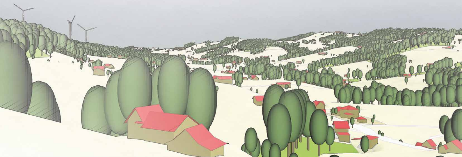
Blick aus Speicher, Höhrüti