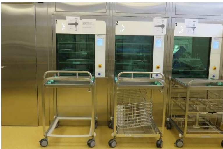
Abbildung: Zentralsterilisation Spitalverbund AR, Herisau

Die Empfehlung bezieht sich auf mengen- und abwasserrelevante Anwendungen von Desinfektionsmitteln im Gesundheitsbereich (Spitäler, Kliniken, Arztpraxen, Pflegeheime etc.) sowie in Lebensmittel verarbeitenden Betrieben (Milch, Fleisch, Getränke etc.). Sie dient den Betrieben als Hilfsmittel für den Ersatz von potentiellen Problemstoffen, ersetzt jedoch die detaillierte Risikobeurteilung im Einzelfall nicht. Nutzerabhängige Dosierung, Wirkung von Stoffmischungen, Eliminationsleistung der betroffenen Kläranlage und Regenwasserentlastungen sind beispielsweise nicht mitberücksichtigt. Gesundheitsgefahren (z.B. krebserregende, giftige oder ätzende Wirkungen) sowie physikalische Gefahren (Explosion, Korrosion, Entzündlichkeit) sind ebenfalls nicht Gegenstand dieser Beurteilung.