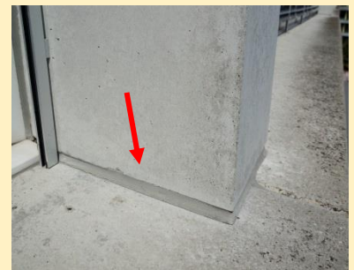
5 Fugendichtung zwischen zwei Betonelementen