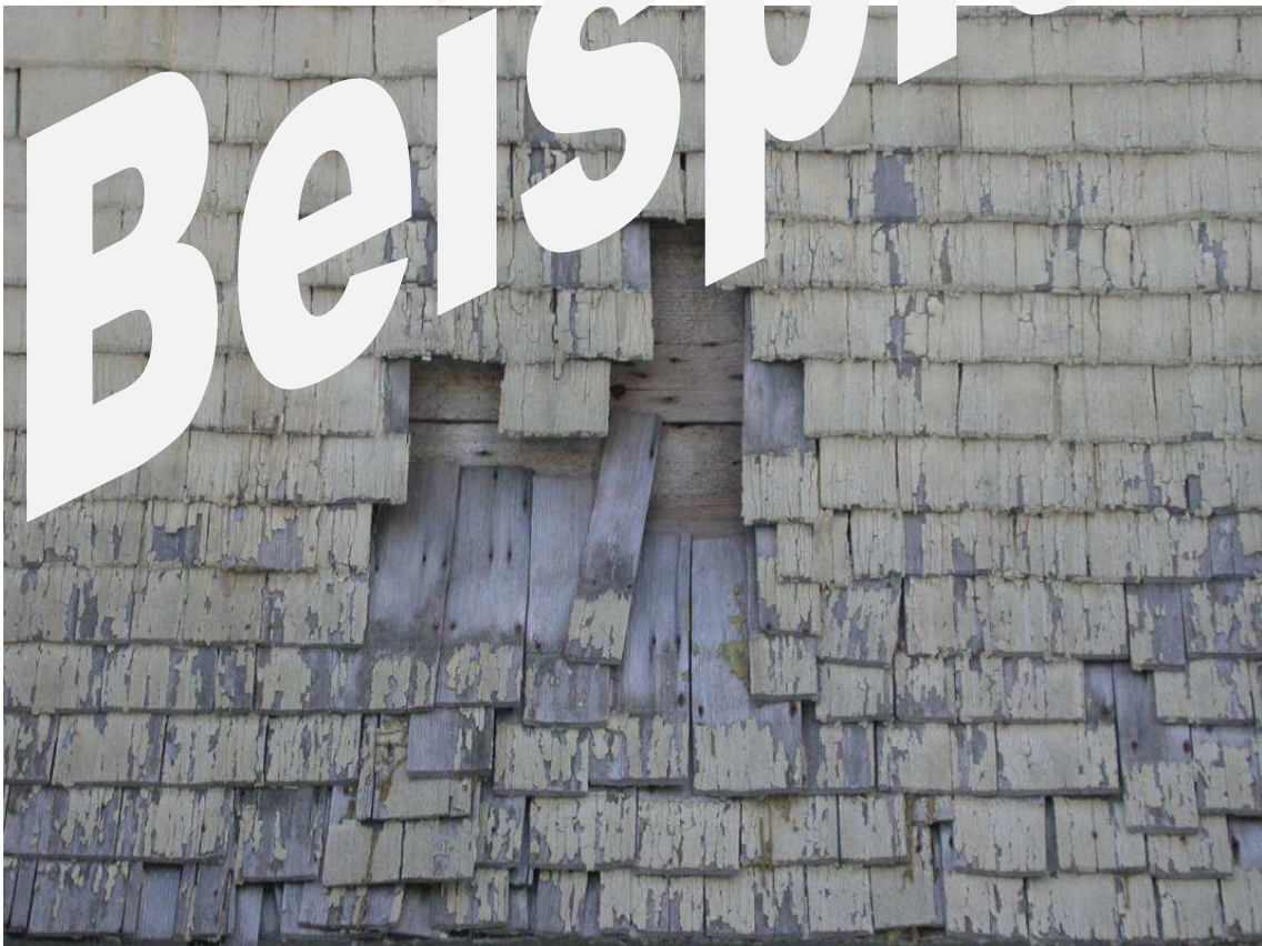
Defekter Schindelschirm Nordfassade