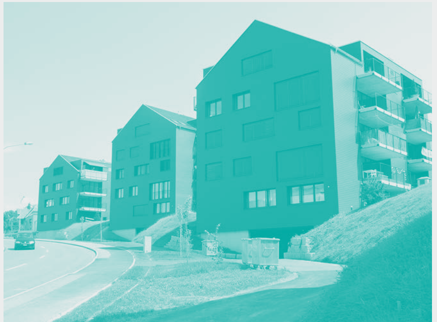
Die Überbauung Friedberg in Wolfhalden markiert den Dorfeingang.

«Wir diskutieren intensiv und zeigen die Vorgaben für ein gutes Projekt auf. Das bringt sowohl Bauherren wie auch der Gemeinde Vorteile.»