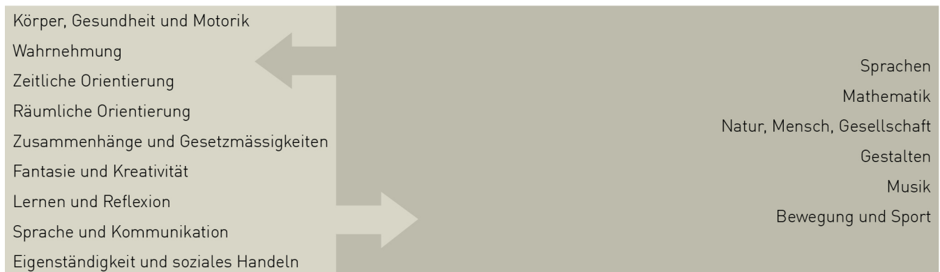
Abbildung 4: Entwicklungsorientierte Zugänge und Fachbereiche Lehrplan 21

Im Verlaufe des 1. Zyklus verschiebt sich der Schwerpunkt des Lernens von der Entwicklungsperspektive hin zum Lernen in den Fachbereichen. Die fachspezifischen Inhalte rücken zunehmend in den Vordergrund. In der Unterrichtspraxis lassen sich die entwicklungsorientierte und die fachorientierte Herangehensweise verbinden, vielfältig variieren und kombinieren. Beide Zugangsweisen bleiben miteinander verknüpft.