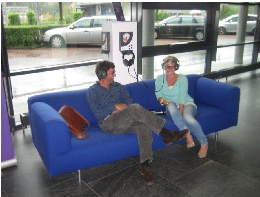
Abb. 4 Anhören der Audio-CD Vätergeschichten (Swisscom)

möglichst passenden Zugang in der firmeninternen Kultur (Umsetzung, Zeitrahmen) zu unterstützen.