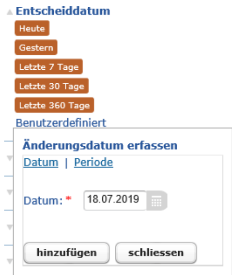
Abbildung 4: Vordefinierte und personalisierte Filtermöglichkeit nach Datum

Mit den Filtern „Entscheiddatum“ und „Publikationsdatum“ kann die Entscheidung nach Entscheidungs- und Publikationsdatum eingeschränkt werden. Neben den vordefinierten Daten „Heute“, „Gestern“, „Letzte 7 Tage“, „Letzte 30 Tage“ und „Letzte 360 Tage“ kann auch ein benutzerdefiniertes Datum bzw. ein benutzerdefinierter Zeitraum bestimmt werden (via Kalender unter dem Texthinweis „Benutzerdefiniert“).