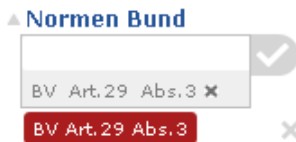
Abbildung 13: Normenfilter mit drei Stufen (Gesetz, Artikel, Absatz)

Der Normenfilter ist mehrsprachig. Es werden sowohl die Erlassabkürzungen als auch die Substufen (Art., Abs., Ziff., Lit.) übersetzt.